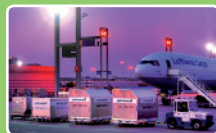
Logistische Gestaltungs- kompetenz