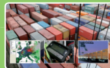
Aktivierung von Clusterpotenzialen